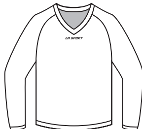
BH-02L Manches longues Long Sleeves