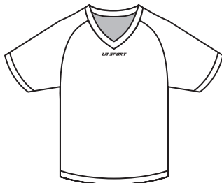
BH-02 Manches courtes Short Sleeves