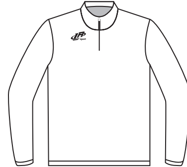
RW-01L Adulte / Adult Unisex / Unisex